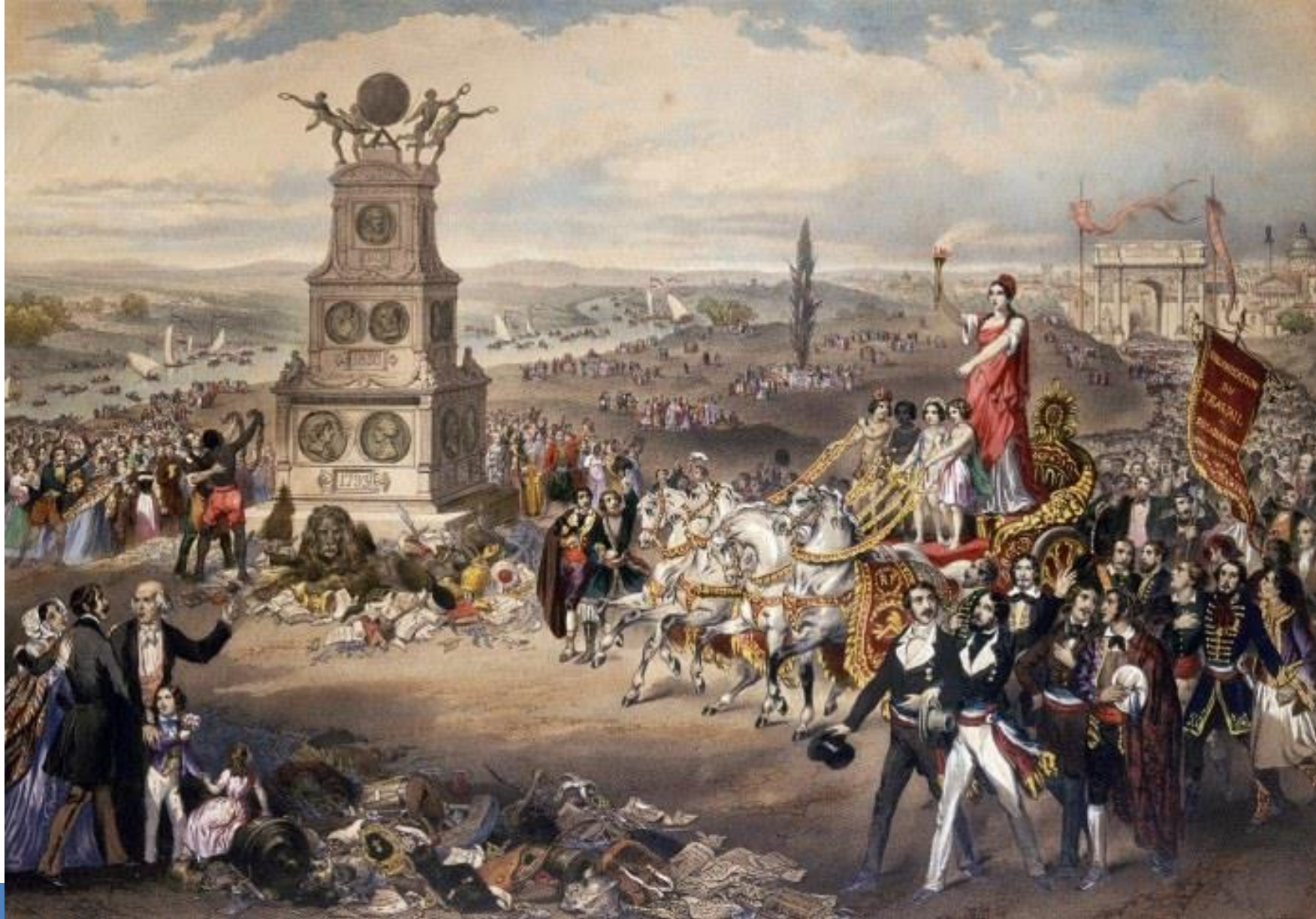
Frédéric Sorrieu, La République universelle démocratique et sociale - Le Triomphe , 1848.