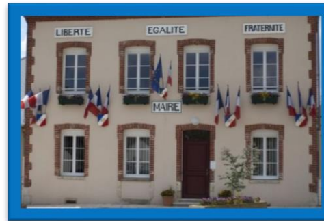
Bâtiment public, ce qui est en rapport avec l'Etat