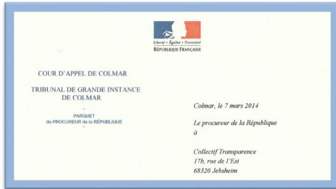
Documents officiels de l'Etat